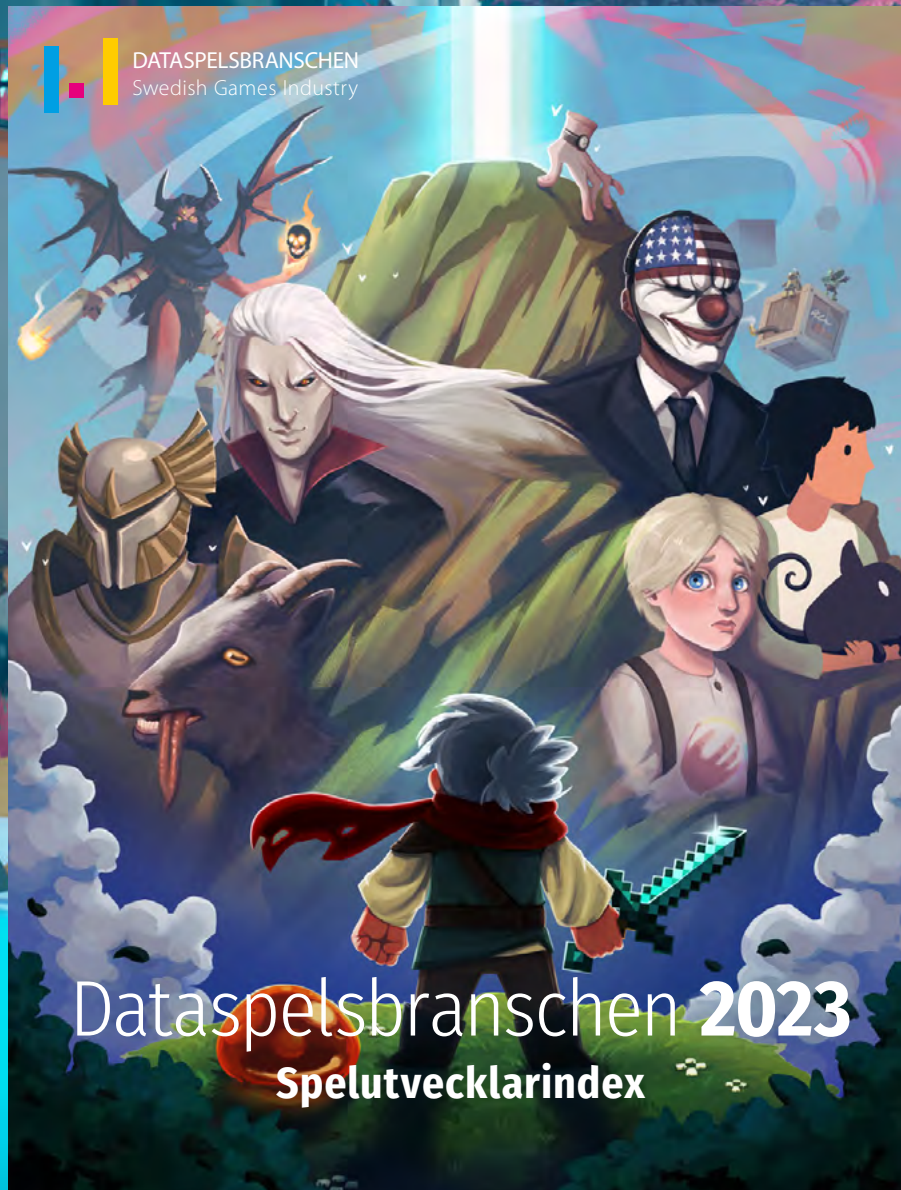
Dimfrost Studio – Bramble: The Mountain King